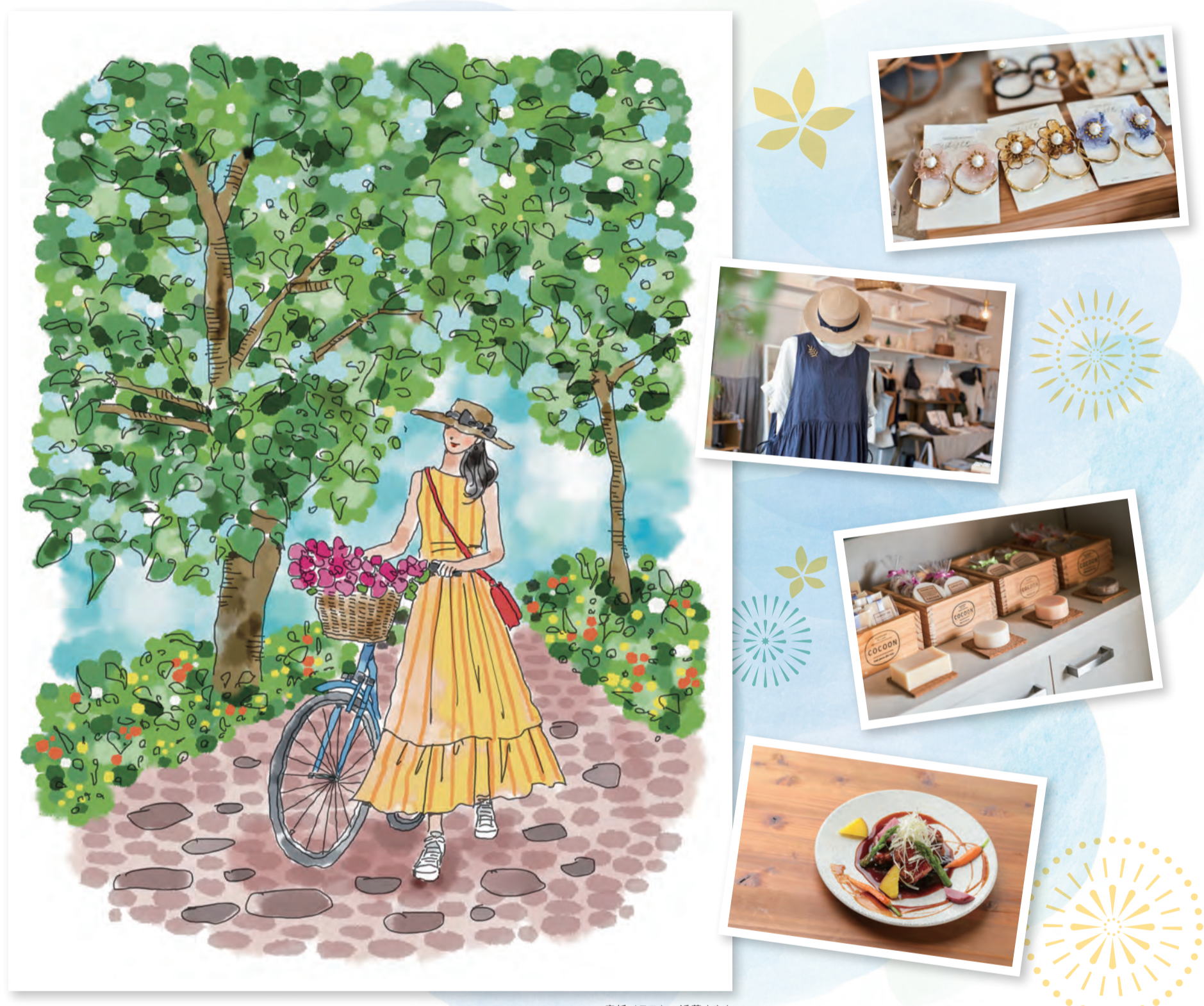
表紙イラスト:近藤さやか